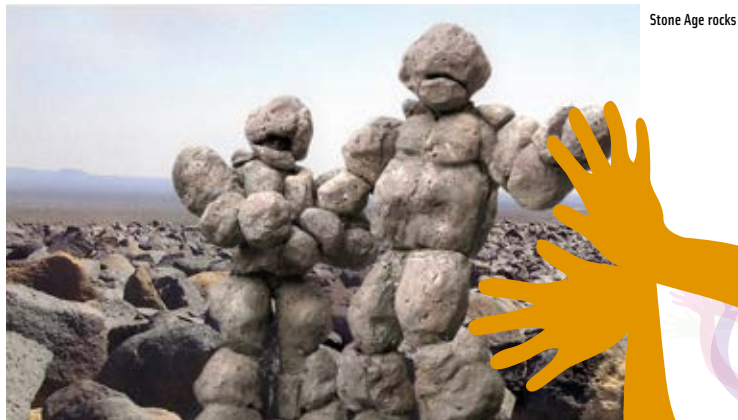
Stone Age rocks