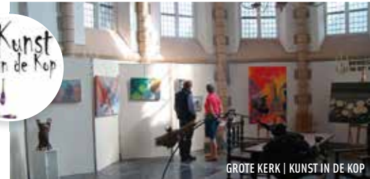
GROTE KERK | KUNST IN DE KOP