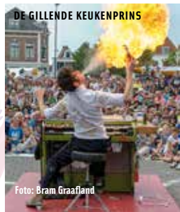
DE GILLENDE KEUKENPRINS