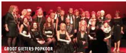
GROOT GIETERS POPKOOR